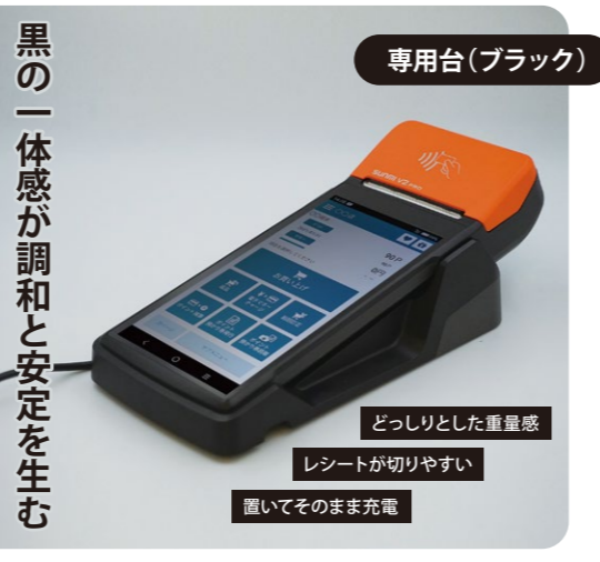
専用台(ブラック) どっしりとした重量感 レシートが切りやすい 置いてそのまま充電 黒の一体感が調和と安定を生む

日本カード株式会社 www.nippon-card.co.jp E-mail nc@nippon-card.co.jp 大阪本社：〒534-0025 大阪市都島区片町 2-2-40 大発ビルディング 8F TEL：06-4800-5710 FAX：06-4800-5700 東京支社：〒101-0041 東京都千代田区神田須田町 1-26-2 芝信神田ビル 5F TEL：03-6824-9180 FAX：03-6824-9181 フリーダイヤル：0120-805-803